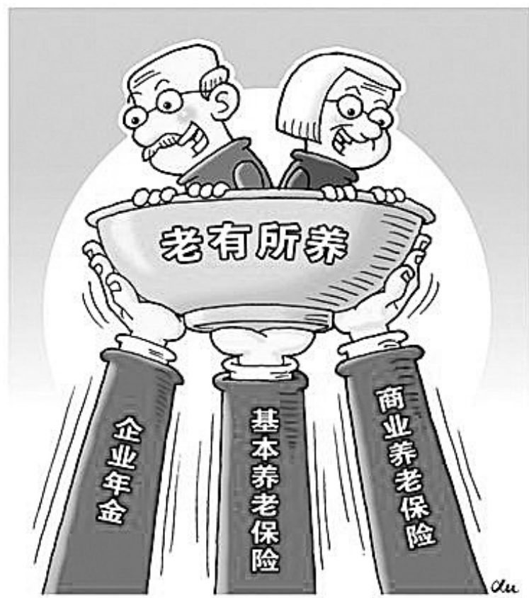
我国养老保险体系三大支柱。

很多人之所以对企业年金比较陌生，是因为这种制度并非像基本养老保险那样普及且强制参保，而是一种企业自愿选择的“补充性养老保险”，目前普及率还不高，只有一些效益较好的企业参加。这种补充性养老保险作为一种增加退休收入的重要手段，被很多企业引以为豪，并用做吸引人才的重要福利待遇。比如，很多人在应聘时会看到企业的招聘简章上写着“五险一金”，这个比通行的“五险一金”多出的“一金”便是企业年金了。很多人还会疑惑——我们单位也给我们上了补充医疗保险啊，为什么这个补充养老保险却从没有听说过呢？这是因为补充医保很多员工会经常使用，拿着医院的票据就可以找单位报销；但是补充养老保险却是一个“悄悄地”每月在工资里被自动扣除，却要等到退休时才会领到待遇的制度，很多在职员工还体会不到它的存在也就不足为奇了。