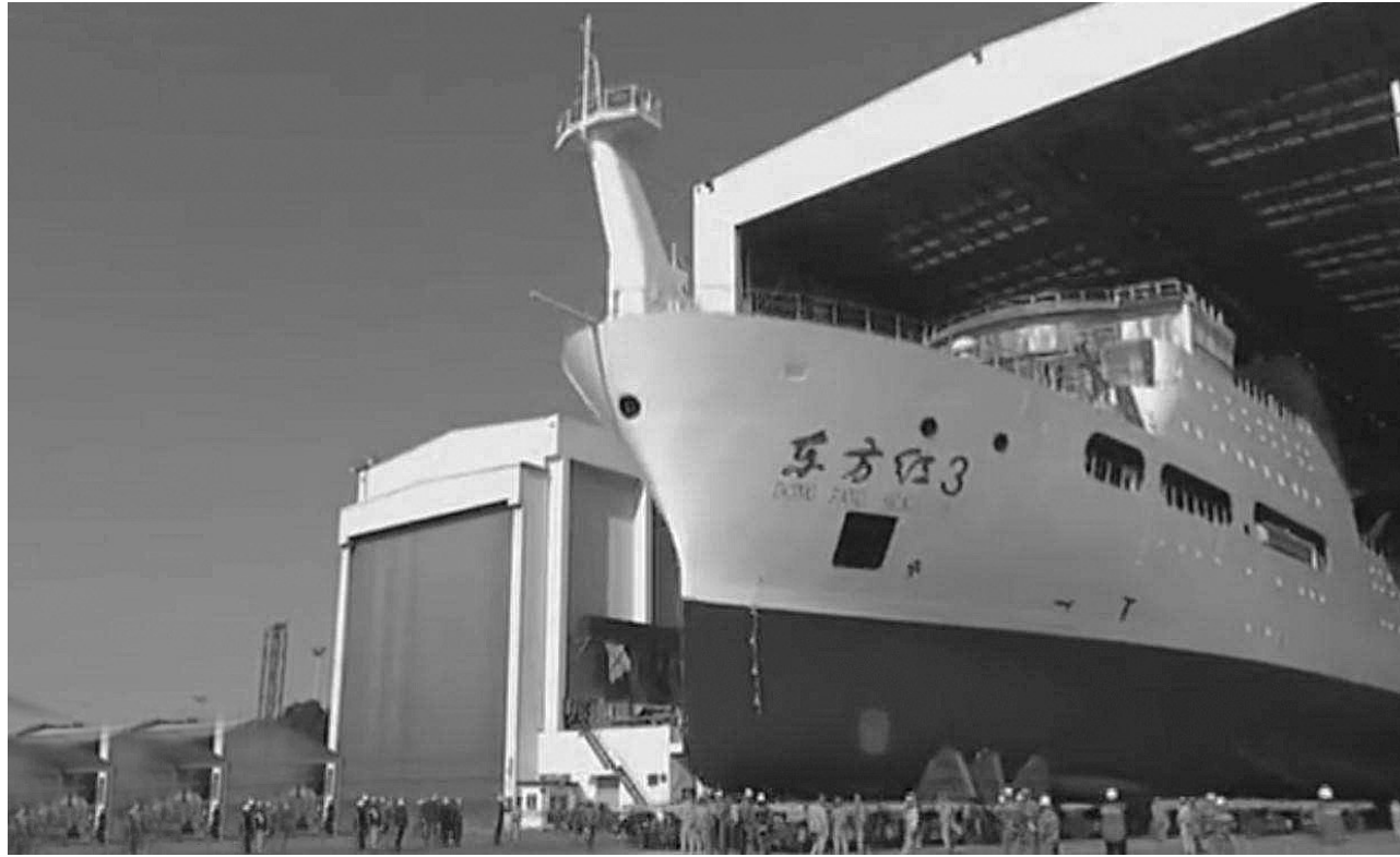
“东方红3”船下水现场。

这艘凝聚着中国智慧、达到国际先进水平的科考船,具备完全自主知识产权,并拥有多项船型设计专利,为人类探究海洋贡献了中国方案。