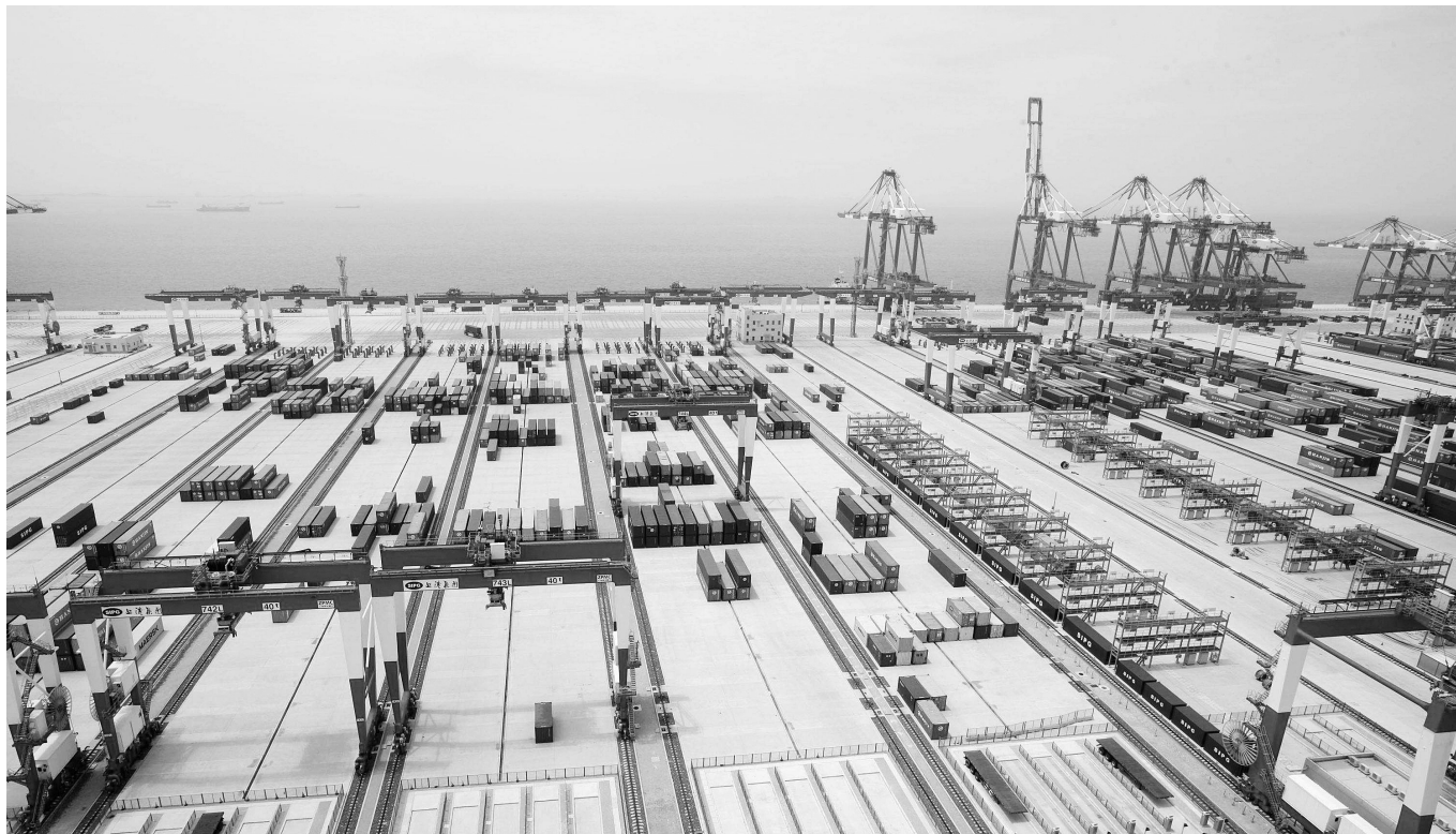
洋山港四期自动化码头全景。

近年来,上海组合港管理委员会抢抓机遇、谋实策、求实效,重点从“两加强、五着力”充分发挥上海组合港的作用,组建了上海国际航运中心“一体两翼”的港口战略组合,基本形成了布局合理、分工明确、干支衔接、功能协调的区域港口体系。