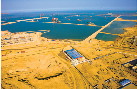
青岛董家口港30万吨级航道疏浚及吹填工程。

“以高质量发展为主线,以改革创新为动力,抢抓新时代战略机遇,加快长江航道工程单位转型升级,朝着建设国内一流世界知名的建设运营服务商奋勇前进。”1月19日,长江航道工程局有限责任公司(以下简称“公司”)党委书记、董事长付绪银在2019年公司工作会提出了企业发展的总体目标和实现路径。