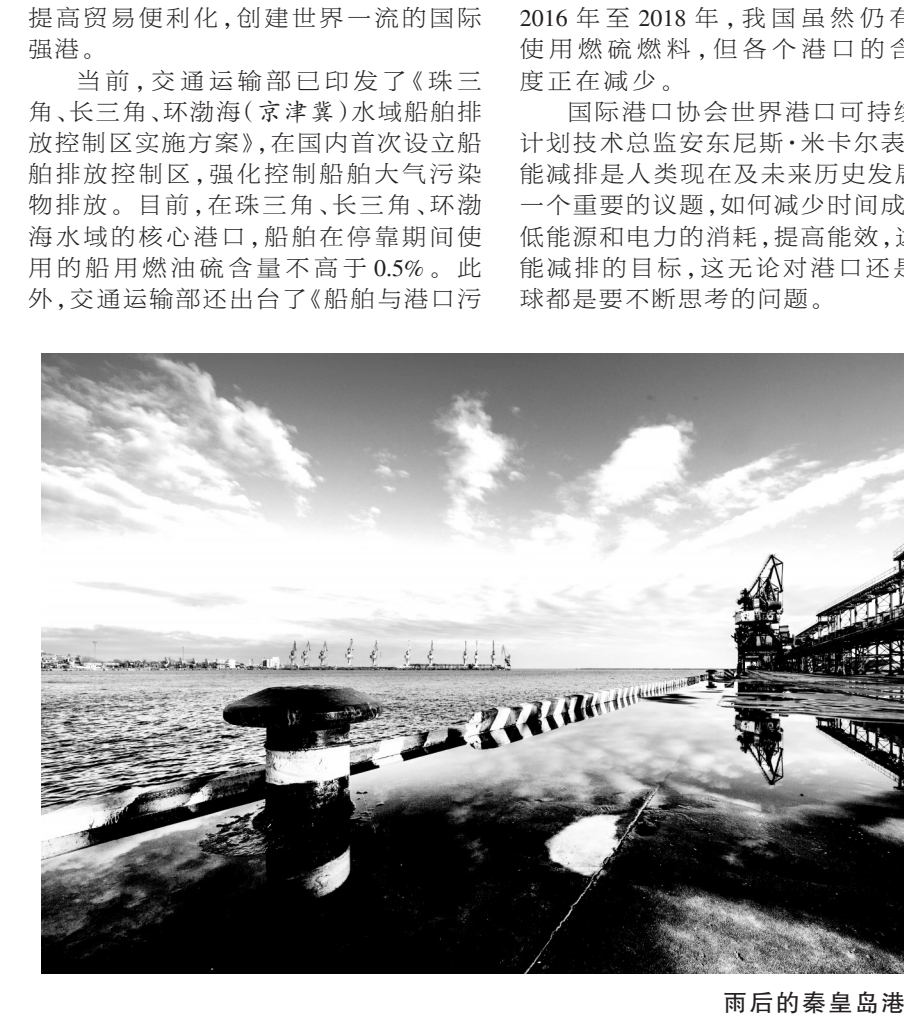
南后的秦皇岛码头。

国际港口协会世界港口可持续发展计划技术总监安东尼斯·米卡尔表示,节能减排是人类现在及未来历史上发展的一个重要议题,如何减少时间成本,降低能源和电力消耗,提高能效,达到节能减排的目标,这无论对港口还是在全球都是要不断思考的问题。