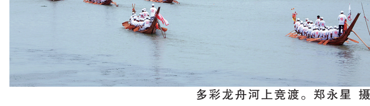
多彩龙舟河上竞渡。

1915年7月，鸭岗村遭受特大洪灾，蚌湖乡亲及时送来粮食、生活用品。两村村民互助往来，情谊日益深厚。以后每年龙舟节，两村相聚一起吃龙舟饭，传承世代情谊。谈笑间，人声喧哗，各围桌上已挤挤挨挨坐满村民来宾，大家热烈交谈，举杯起箸，不时爆发震天动地的笑声。勤劳手巧的村妇们鱼贯穿梭，手捧一盘盘香气氤氲的菜肴上桌，除了炒龙船丁，还有村宴中出现的脆椒鲈鱼、香芋焖鹅、糖醋排骨、绍菜鱼弹、脆皮烧肉、蒜苗鸡杂、白灼大虾、清蒸鲩鱼，多用蒸煮手法制作，九菜一汤，寓意十全十美、吉祥如意。