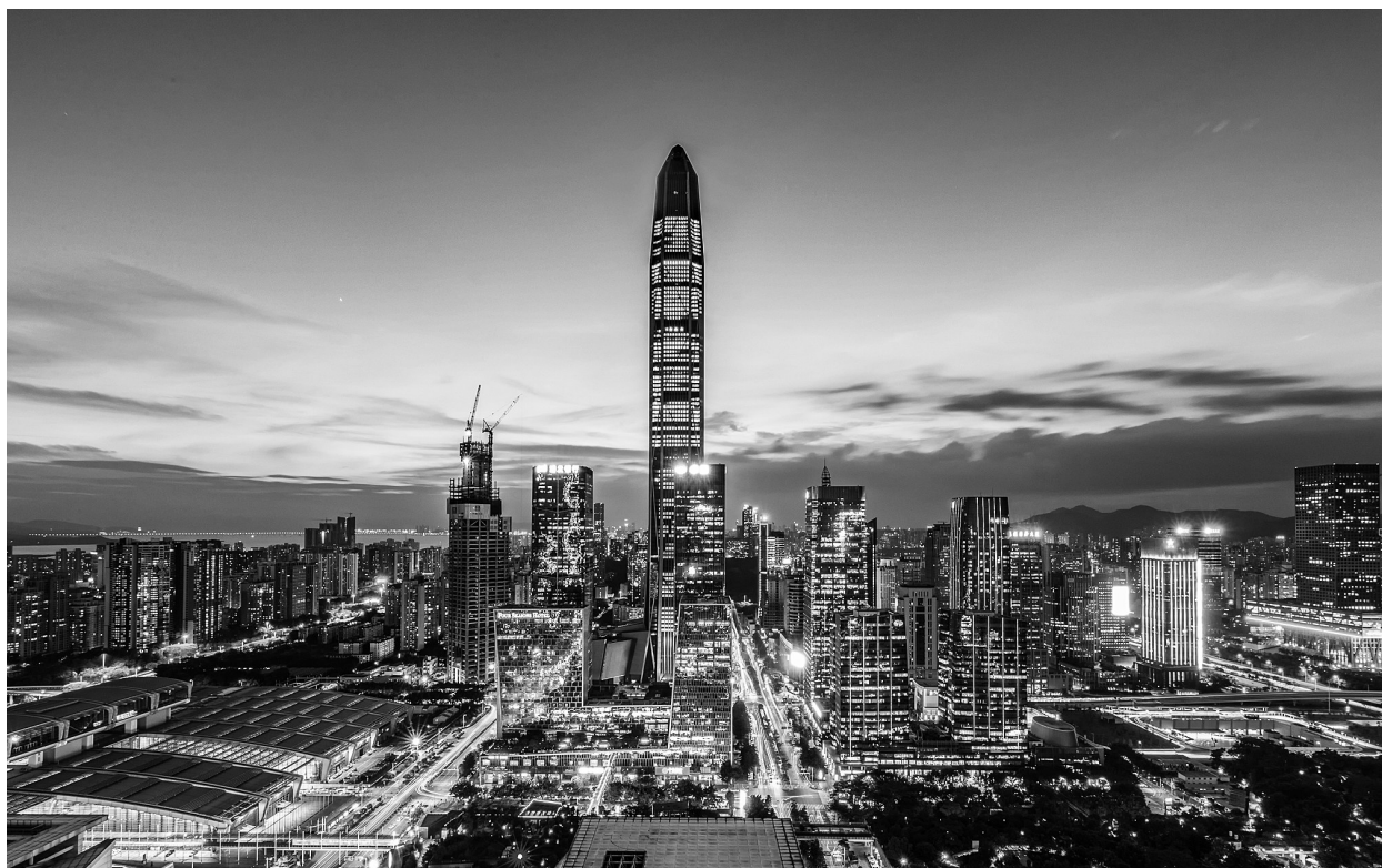
深圳福田高楼林立。

根据《意见》设定的发展目标,到2025年,深圳经济实力、发展质量跻身全球城市前列,研发投入强度、产业创新能力世界一流,文化软实力大幅提升,公共服务水平和生态环境质量达到国际先进水平,建成现代化国际化创新型城市。到2035年,深圳高质量发展成为全国典范,城市综合经济竞争力世界领先,建成具有全球影响力的创新创业创意之都,成为我国建设社会主义现代化强国的城市范例。到本世纪中叶,深圳以更加昂扬的姿态屹立于世界先进城市之林,成为竞争力、创新力、影响力卓越的全