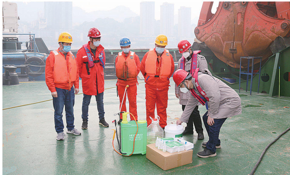
2月13日,长江干线航道建设重点工程——长江上游九龙坡至朝天门河段航道建设工程正式复工。工程复工后主要采用抓斗挖泥船开展疏浚及清礁施工,以单船为单位分散独立施工,实施封闭管理。