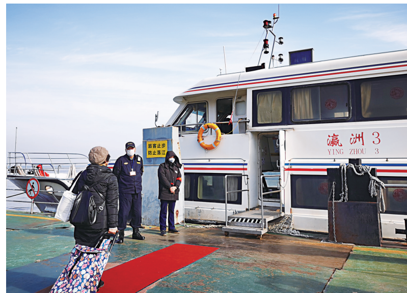
2月10日,随着上海企业陆续复工复产,崇明三岛水上客运达2374人次,宝山海事加强现场检查,全力保障复工人员的出行安全。