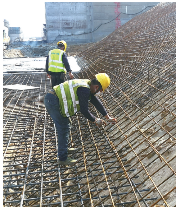
2月11日,在闽江水口水电站枢纽坝下水位治理与通航改善工程施工现场,施工人员佩戴口罩进行钢筋绑扎。