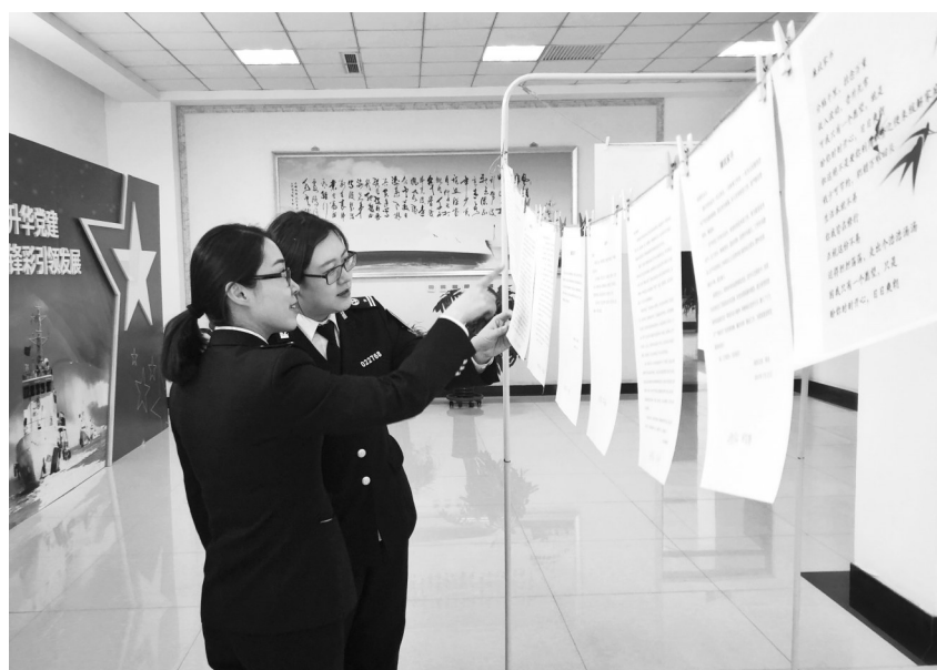
天津东疆海事局举行廉政家书展。