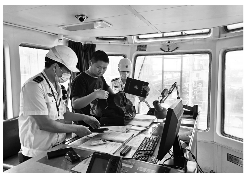
宁波海事局执法人员进行水上无线电秩序管理专项整治检查。

模范机关建设是一个需要长期坚持的系统工程，争当建设“重要窗口”“模范生”更需要持之以恒、不懈努力，宁波海事人将以党建为引领，不忘初心、继续前行，用实际行动书写让党中央放心、让人民群众满意的时代新答卷。