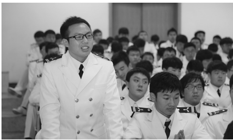
轮机工程专业学生课堂活动。