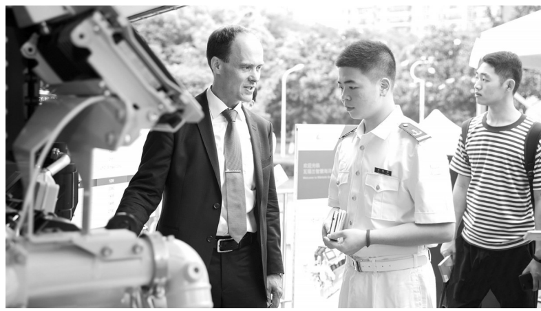
武汉理工大学能源与动力工程学院邀请名企进校园指导学生开展实践。

多措并举之下,武汉理工大学能源与动力工程学院为培养具备现代船舶机电一体化管、用、养、修能力的高端复合型人才奠定了坚实基础。