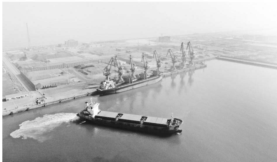
渤海湾港矿石码头。

渤海湾港以提升客户服务质量，增加客户粘性，增强港口主业的核心竞争力为目标，不断创新业务模式，扩展港口物流、金融、贸易服务功能，为客户提供更优的增值服务。在全程物流业务方面，上半年渤海湾港共完成铁矿石、砂石料、煅后焦、锂精矿等业务11笔，实现收入589万元，客户服务满意度迅速提升。