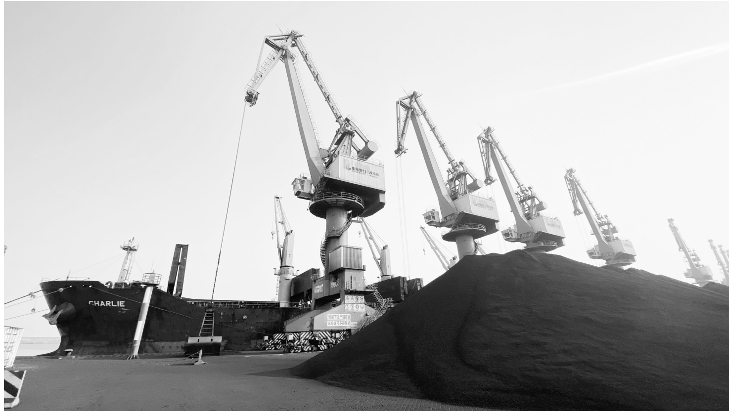
渤海湾港煤炭装卸现场。

广利港区积极推行计划、中控、现场三位一体“大配工”模式，力争各生产要素效能最大化，并推行船舶满泊、机械热接的“满泊热接”组织模式，实现作业机械无缝衔接，大幅度提升作业效率和泊位利用率。5月10日，广利港区完成集疏港1363车次，集疏港作业量4.27万吨，昼夜集疏港车次和作业量均创历史新高，这是今年以来第三次刷新历史最高纪录。