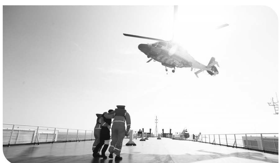
▲全国首个石油平台海域通航安全风险防范演习。