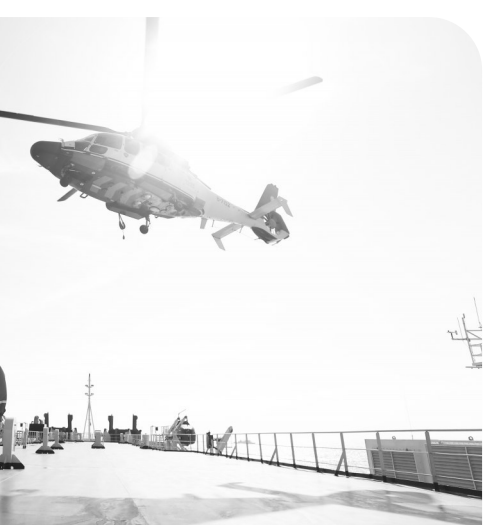
▲全国首个石油平台海域通航安全风险防范演习。

海上搜救工作点多、线长、面广，具有风险高、时间紧、救助难度大等特点，需要协调一切政府和其他社会资源，组织各种力量对遇险人员开展搜救救助。天津海事局指挥中心党支部固制度、强联动，聚合壮大搜救“主力军”，打造搜救“可靠力量”的步伐从未放缓。