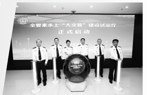
▲全要素水上“大交管”建设试运行启动。

天津，依海而生，向海图强。近年来，天津港货物吞吐量一直居于我国港口前列，海上搜救工作在此越发重要。