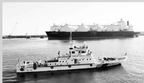
▲海巡船保障LNG船舶靠港。