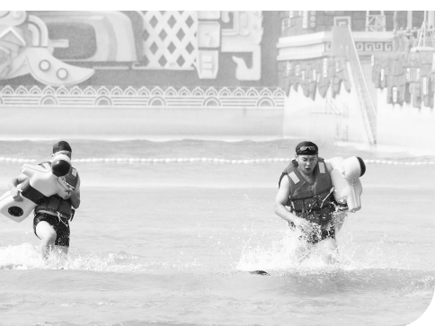
▲天津市青年海上搜救技能比武现场。

顺体制、理机制方面，天津海事局指挥中心推动成立了天津市滨海新区海水水上搜救分中心，构建了一个中心、五个分中心的两级水上搜救管理格局，织密水上搜救应急网络，并积极探索浅水区应急救援手段，编制《浅水区险情应急处置简明操作手册》，从程序、装备、队伍、演习等多层面构建浅水区应急救援模式。