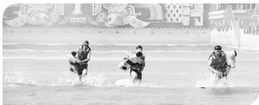
▲天津市青年海上搜救技能比武现场。

2021年7月26日，天津海事局指挥中心组织开展了全国首个石油平台海域通航安全风险防范演习，中心注重发挥战斗堡垒作用，提升服务效能，首次融合卫星通信、微波自组网和海岸电台多种技术手段于一体的远程可视化通信指挥演练，全方位锻炼了天津市海上搜救队伍应对处置中远海特别复杂海上险情能力，得到了交通