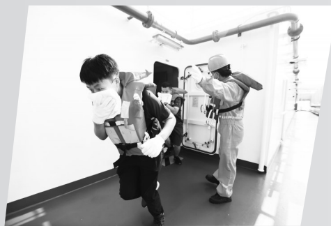
▲天津市海上搜救综合演习。