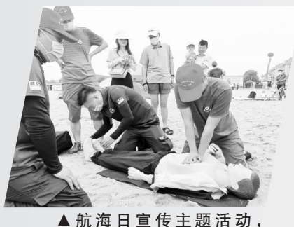
▲航海日宣传主题活动，现场教学抢救措施。