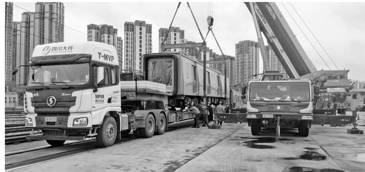
四川大件公司运输返修车辆。

四川港投所属泸州港、宜宾港、南充港、广安港严格水上运输管理,严格落实船舶隔离,严把陆路进闸关,集中力量抓好靠港船舶、进口集装箱消杀工作,加强管控开箱作业、船舶物资交接、船员管理、开箱操作人员隔离闭环管理,有效落实疫情防控措施,确保川南、川东北水上运输通道畅通。广安港开设绿色通道,专供中国移动、顺丰、科伦药业等企业使用,确