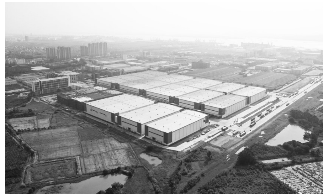
京东物流园区。

物联网、云计算、人工智能等新一代信息技术的运用，以智能化设施设备为基础，通过人、物、系统、资源等多方数据传递和交换，实现物流园区管理、服务、运营的全面数字化和智慧化。现实操作中，可以根据不同类型、不同需求推进智慧化运营。