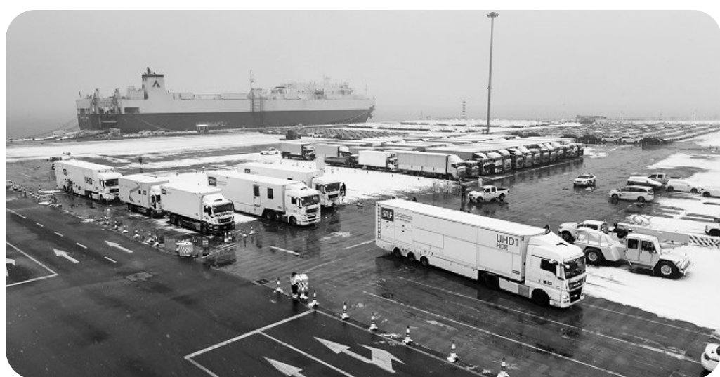
冬奥会转播车在天津港转运。

中国国际可持续交通创新和知识中心，正是新时代中国交通“强起来”的见证，将更有力推进全球交通合作，书写基础设施联通、贸易投资畅通、文明交融沟通的新篇章。