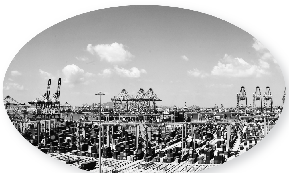
青岛港自动化码头。

过去的一年，无数交通人在平凡中坚守，于坚守中奋进，汇聚起加快建设交通强国的磅礴伟力，奏响了交通运输高质量发展的动人合唱。2023年是全面贯彻党的二十大精神开局之年，交通运输人将更加紧密地团结在以习近平总书记为核心的党中央周围，深刻领悟“两个确立”的决定性意义，增强“四个意识”、坚定“四个自信”、做到“两个维护”，全面贯彻党的二十大精神，埋头苦干实干，奋力加快建设交通强国，为全面建设社会主义现代化国家开好局起好步提供有力支撑。