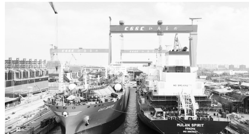
9.3万立方米双燃料超大型液化气船(右)。

GC)精品船型(Panda 93P),也是国内首艘使用MarkIII型液货舱,同时配有双燃料主机和发电机的液化天然气运输船。船舶设计理念最新,航速和油耗等综合经济技术新能指标处于行业领先水平,是一艘“未来型”绿色船舶。与此同时,本次作业还有一艘液化天然气(LNG)运输船出坞,两艘半船进坞。