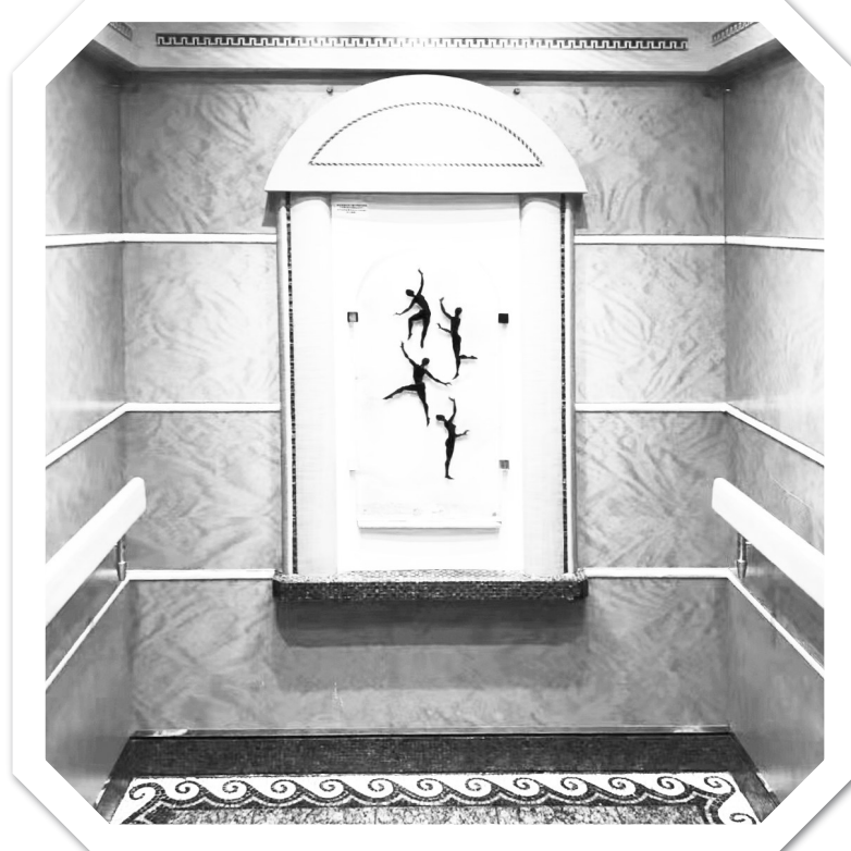
▲28部电梯均已达到机械完工状态。 ▼累计完成近20000米塑料管安装、750多个背景ITR提交以及400个试压包的管路密性和复原。