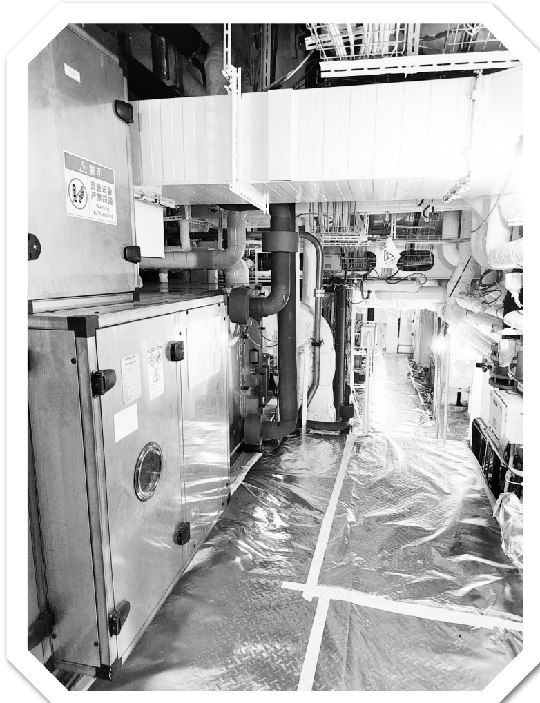
▲管系绝缘及油漆作业等处于收尾阶段。