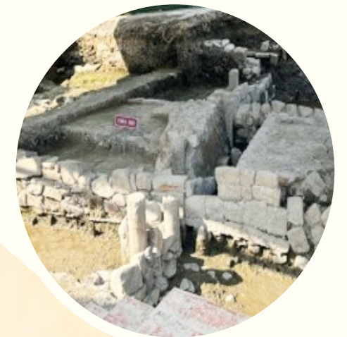
温州朔门古港遗址。