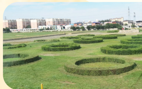
洛阳隋代“回洛仓”遗址。