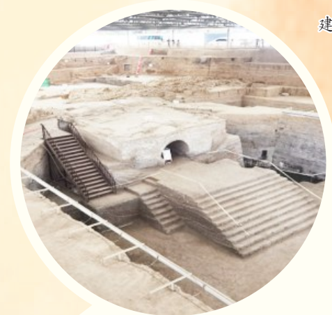
开封州桥考古现场。

“古代”是对应近代和现代而言的,按照当代中国史学理论和实践,以1840年和1949年为历史分期。1840年鸦片战争前为古代史,因为1840年鸦片战争改变了中国社会的性质,从封建社会转变为半殖民地半封建社会,毛主席著作中对此有深刻的分析。从1840年到1949年10月1日中华人民共和国成立,是近代史,是中国人民奋起反抗,推倒三座大山的历史。从社会发展来说,也是中国近代文明,民族工业的兴起,包括交通运输行业在反剥削压迫中缓慢成长。1949年10月1日中华人民共和国成立以来为现代史,尽管70多年来走过的道路曲折,但在中国共产党的领导下,我们从胜利走向辉煌。党的十八大进入新时代,走上了建设中国式现代化的新征程。中国人民已经屹立于世界民族之林。