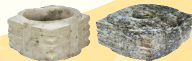
良渚文化标志玉琮。