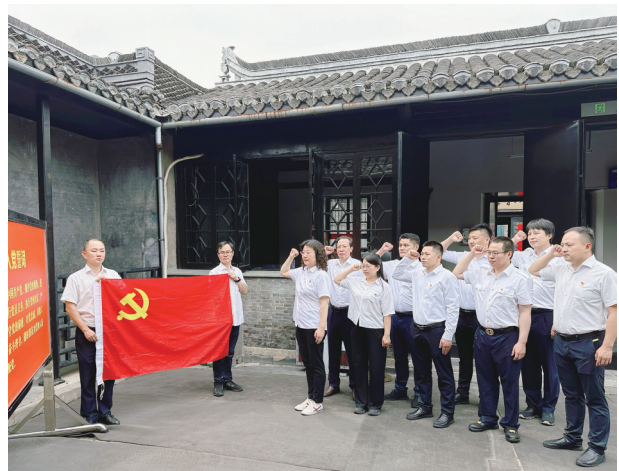
南京长通绿色航运有限公司、长江南京以下12.5米深水航道养护项目部和“长鲸12”轮党支部党员重温入党誓词。