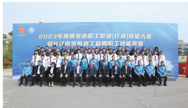
举办2023年南京市职工职业(行业)技能大赛航道工程安全一级竞赛和航道水手工艺二级竞赛。