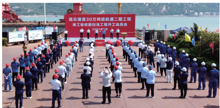
连云港港30万吨级航道二期工程竣前扫浅工程举行开工仪式。