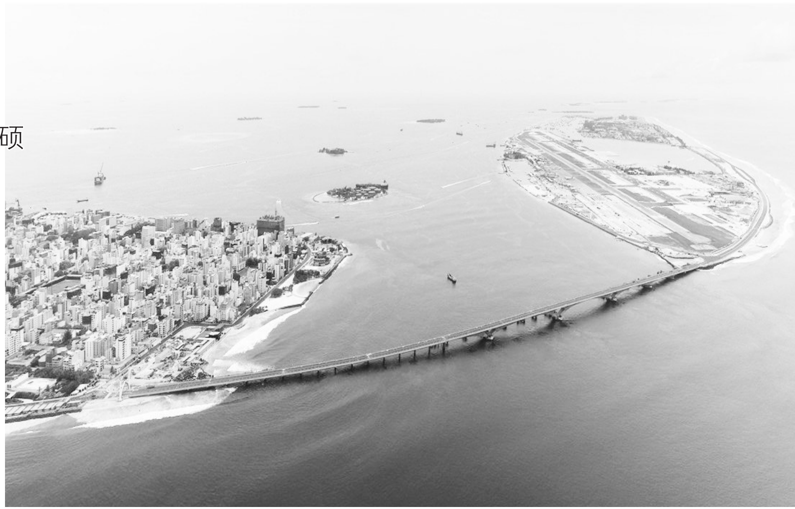
马尔代夫中马友谊大桥。

基础设施互联互通作为“一带一路”建设的优先领域，也是推进“一带一路”合作的核心。中交集团以基础设施建设为抓手，大幅提升了共建国家互联互通程度。