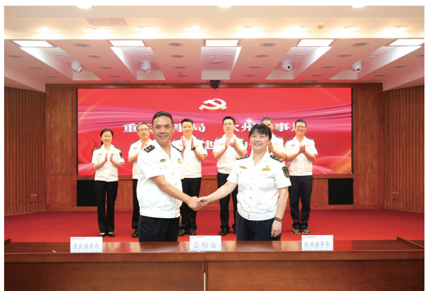
重庆海事局与钦州海事局合作共建。

不积跬步，无以至千里；不积小流，无以成江海。新旧动能转换，关键靠创新。重庆海事局作为内河开放口岸海事监管部门，顺势而为、顺势而上，主动融入国家发展战略，勇做破局者、开创者，以共建共治护“朋友圈”，以创新举措推动物流降本增效。