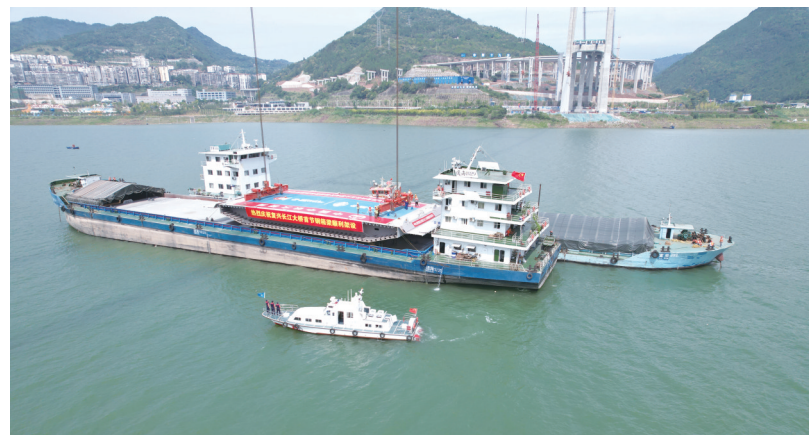
桥梁吊装现场维护。

重庆地处大山区大库区，地质灾害高发易发，长江干线重庆段危岩地灾点多面广、隐蔽性强、突发性强，对长江黄金水道航行安全和人民群众生命财产安全造成较大威胁。