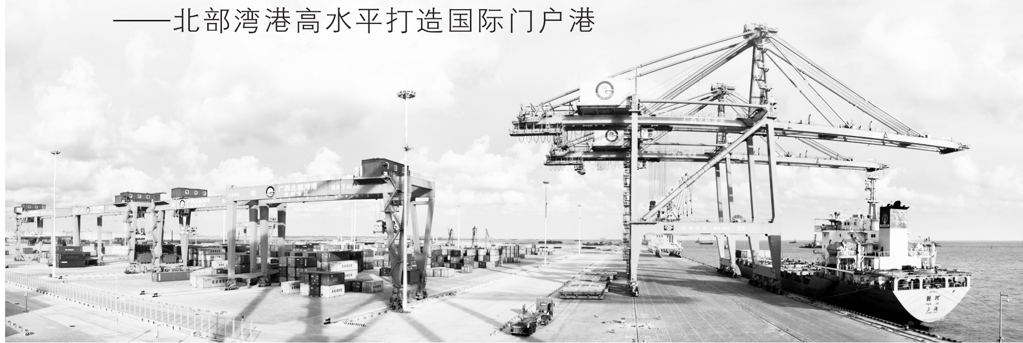
北部湾港码头。

对内,北部湾港的西部陆海新通道海铁联运班列已通达我国18省71市149站点,实现西部地区全覆盖,2023年开行海铁联运班列9580列,同比增长8.6%。对外,北部湾港共开通内外贸集装箱航线76条,通达全球集装箱港口,辐射范围涵盖100多个国家和地区的200多个港口。北部湾港(本港)货物吞吐量从2017年的1.56亿吨增长到2023年的3.1亿吨,年均增长率达12.1%;其中,2023年集装箱吞吐量突破800万标箱,货物和集装箱吞吐量稳居全国沿海港口前十。