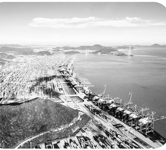
宁波舟山港穿山港区。

开放，是中国式现代化的鲜明标识。习近平总书记强调：“中国将坚持推进高水平对外开放，以高质量发展全面推进中国式现代化，为各国开放合作提供新机遇。”在地方两会上，“扩大高水平对外开放”成为热门话题。政府工作报告明确了方向，代表委员们共同谋划发展蓝图。