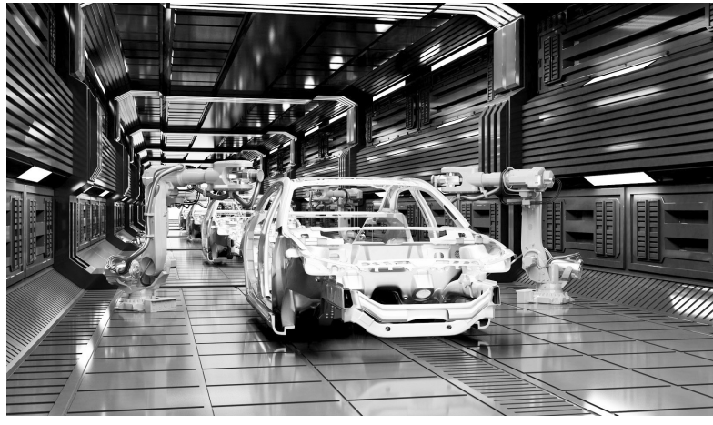
本版文字综合央视网、中国经营网、中国水运网等媒体报道

中国汽车工业协会副秘书长陈士华表示,在消费端,短期来看政策并不是完全退出,仍保留减半优惠,对于主流的市场,尤其是15万元到30万元价格的区间,仍具有一定的消费托底的作用。从长期来看,在生产端,促使车企加速技术创新和供应链的优化,推动中国汽车产业实现更高质量、更可持续的发展。